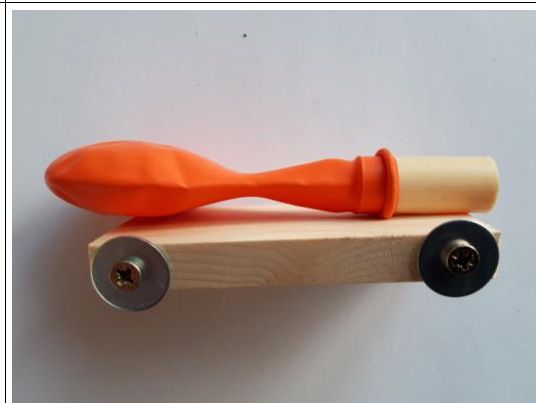
Auto klaar. Opblazen en racen maar.

Instructiefilmpje is te vinden op de open dagen website van Yuverta Kesteren.