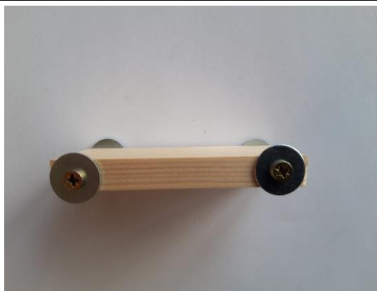
Schroef de 'wieltjes' aan de auto. Ze moeten vrij kunnen draaien.