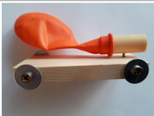
Schroef 'buisje met ballon' vast aan auto