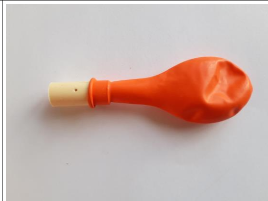
Plaats de ballon om het buisje Gaatje moet vrij blijven