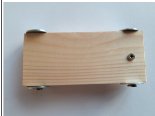
Doe het kleine schroefje door de auto.